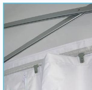
Mur coulissant en partie haute