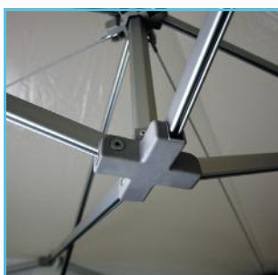
Pièce de connexion injectée fibre de verre.