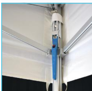
Poignée de verrouillage ZP