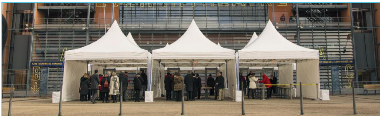
Pagode ZP 5x5m