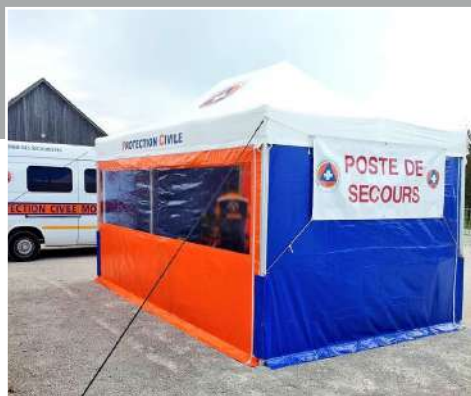
TENTE PLIANTE DE SECOURS