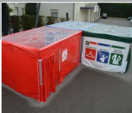
TENTE DE DÉCONTAMINATION