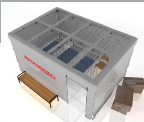
TENTE D'INTÉRIEUR À TOIT PLAT